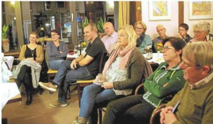
Im Kleinen Café: Bei der spannenden Lesereise, bei der brennende Kerzen den Weg durch Billerbeck weisen, finden alle der sehr unterschiedlichen Autoren ihr Publikum.

Pale gehört wie auch die elf anderen Autoren, die die Billerbecker Lesenacht zu einem vielseitigen und spannenden Abenteuer machen, zum „Bundesverband junger Autoren“ (BVJA), der an diesem Abend sein 30-jähriges Bestehen feiert. Der Verband fördert Schreibende jeden Alters, die sich neu im Literaturbetrieb behaupten